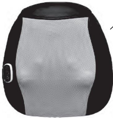
MASSAGE DE DOS SHIATSU