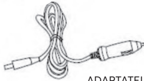
ADAPTATEUR POUR PRISE D'AUTO